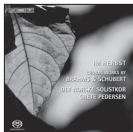
Im Herbst: Choral Works by Brahms and Schubert BIS-1869 SACD