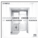
Edvard Grieg: Choir Music BIS-1661 SACD

These and other recordings from BIS are also available as high-quality downloads from eClassical.com