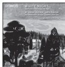
White Night: Impressions of Norwegian Folk Music BIS-1871 SACD