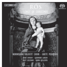
Rós – Songs of Christmas BIS-2029 SACD